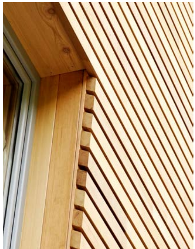
Fachada de laminas de cedro rojo de Canadá con finger joint para celosías o fachadas ventiladas